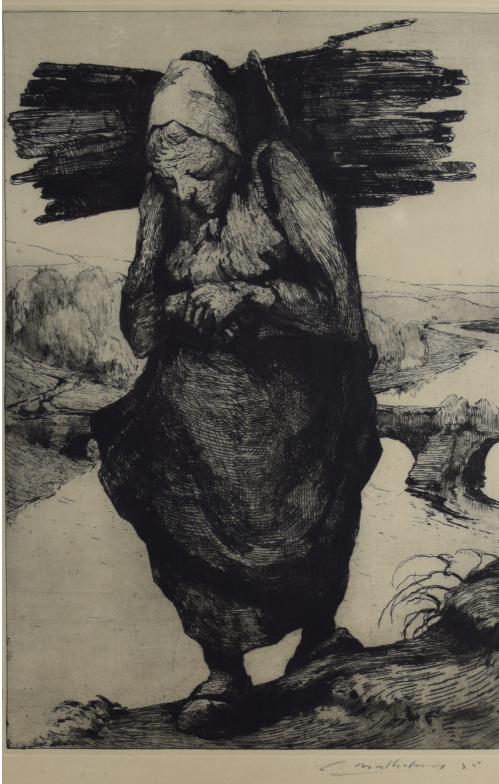
Tableau - "La hotteuse de Chiny"