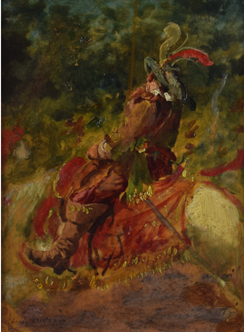
Tableau - "Le cavalier"