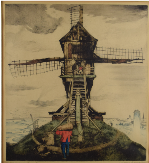
Tableau - "Le moulin dans la plaine (Vilvorde)"