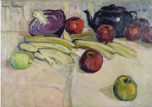
Tableau - "Nature morte aux pommes"