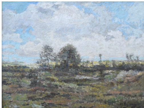
Tableau - "Paysage de (campine)"