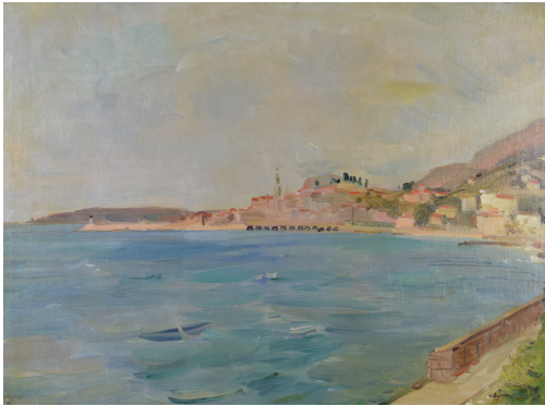
Tableau - "Menton (vue prise de Garavan)"