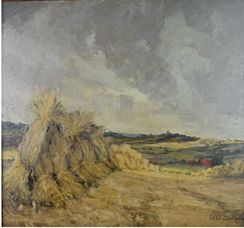
Tableau - "Après la moisson "