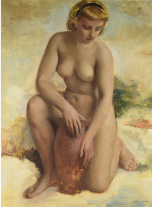
Tableau - "La jeune femme"