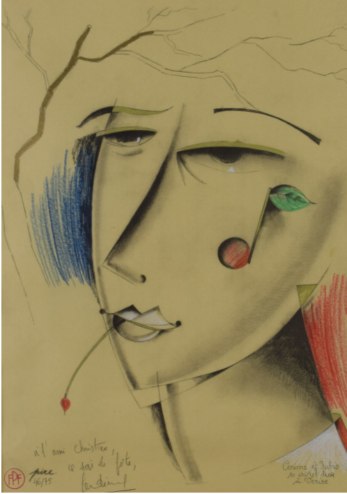
Tableau - "Le visage"