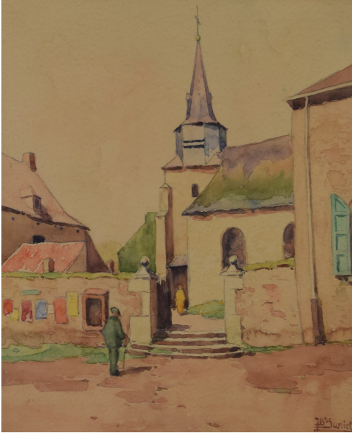
Tableau - "L'église de Dave"