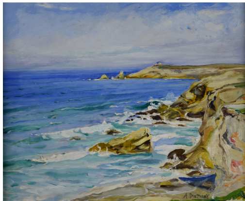
Tableau - "La bretagne"