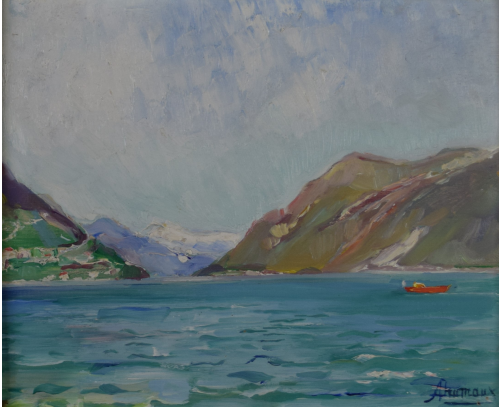
Tableau - "Promenade sur le lac"