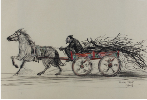
Tableau - "Le transporteur "