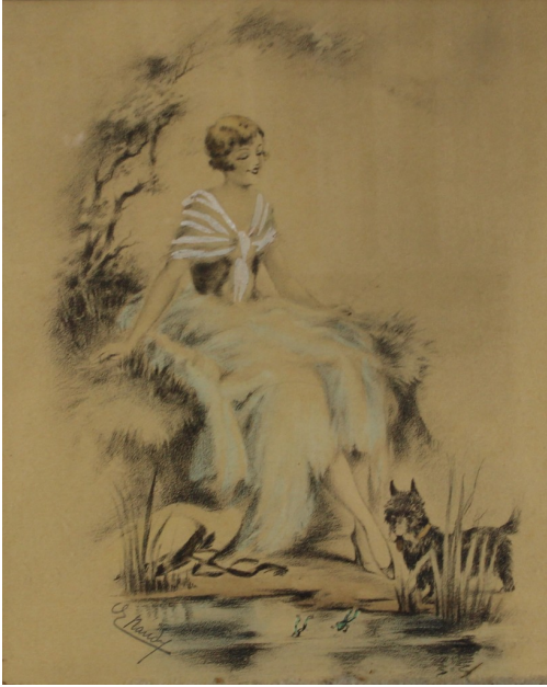
Tableau - "Les compagnions"