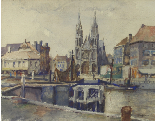
Tableau - "Ostende"