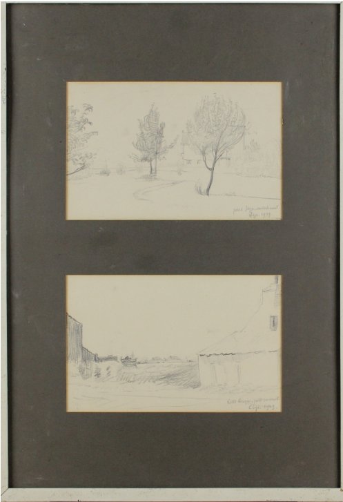
Tableau - "Pour Jaja"