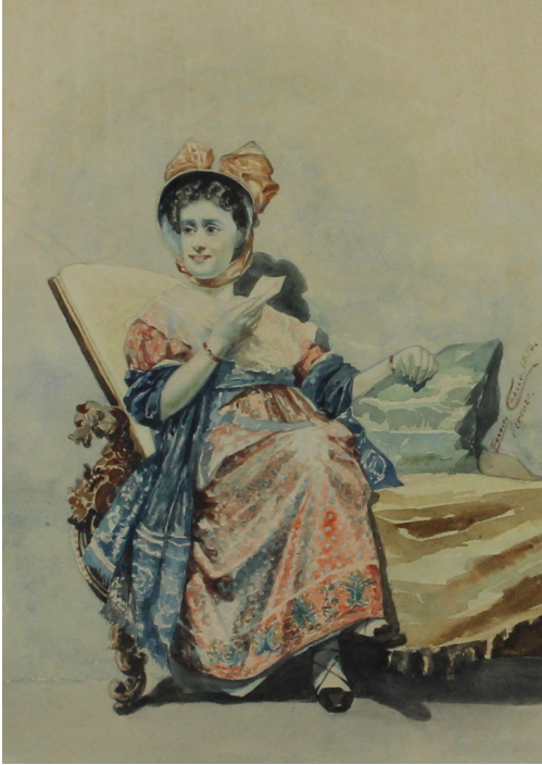
Tableau - "Repos À Venise"