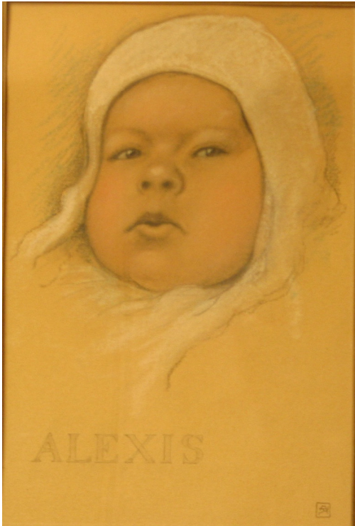
Tableau - "Alexis"