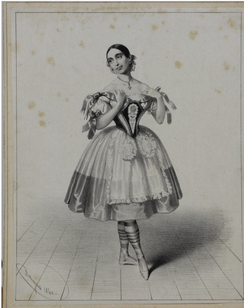
Tableau - "La danseuse"