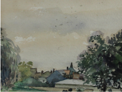
Tableau - "Vue de Stavelot"