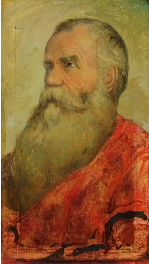
Tableau - "l'homme À la barbe"