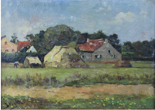
Tableau - "Travail À la ferme"