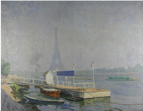
Tableau - "Pont de Passy (tour eiffel )"