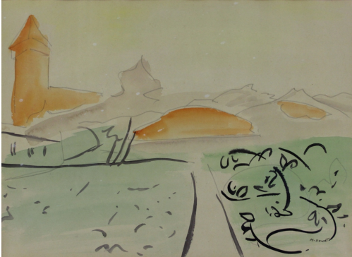
Tableau - "Saint Bertrand de Comminges"