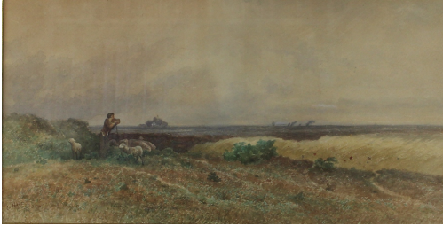
Tableau - "Le berger"