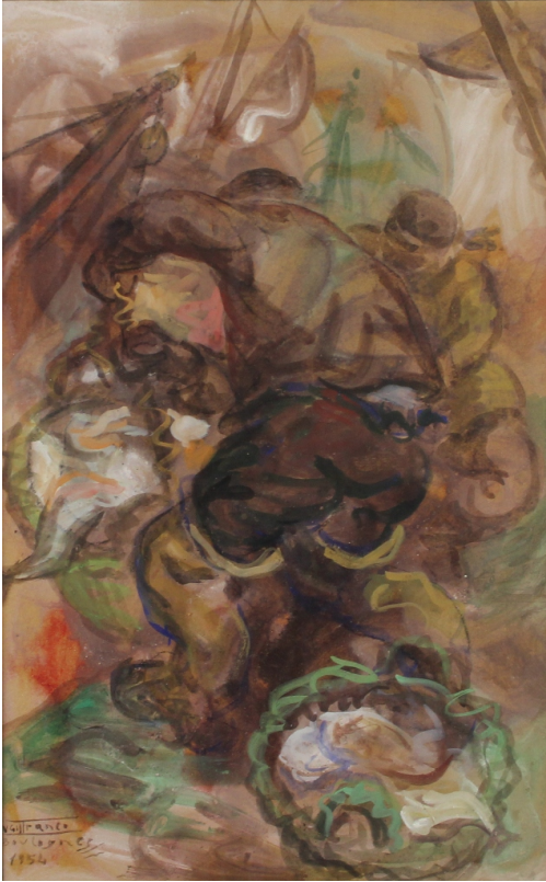
Tableau - "Les pêcheurs 'boulogne'"