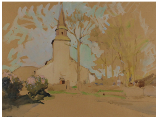
Tableau - "L'Église"