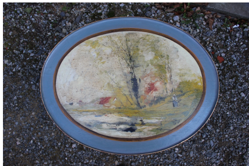
Tableau - "Paysage sur tablette"