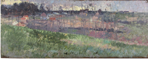
Tableau - "Paysage BrabanÃ§on "