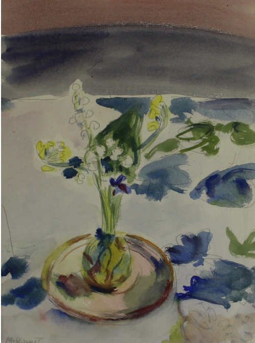
Tableau - "Les fleurs"