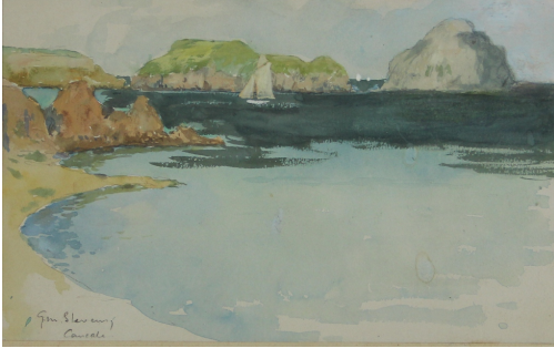
Tableau - "Vue de Cancale"