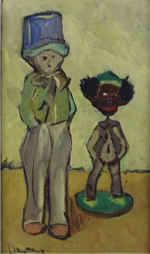
Tableau - "Les deux amis"