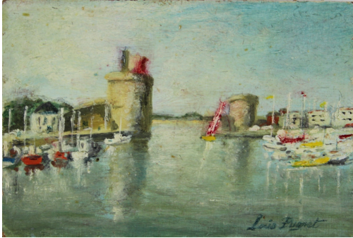
Tableau - "l'entr e du port"