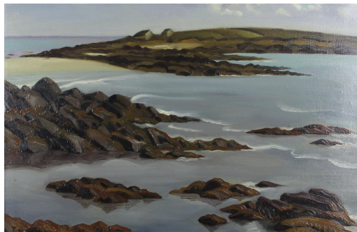
Tableau - "Ile de Raguenes (Bretagne)"