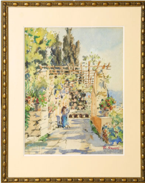
Tableau - "Monastère de Cimiez"