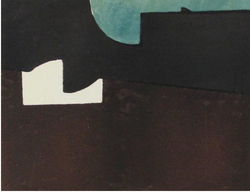
Tableau - "Sans titre"