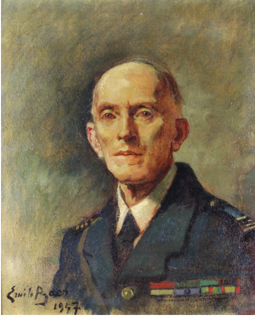
Tableau - "Le militaire"