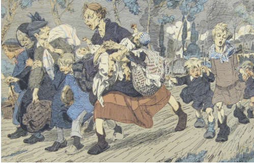
Tableau - "La fuite"