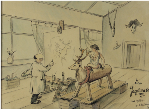
Tableau - "Aventure de chasseurs 2"