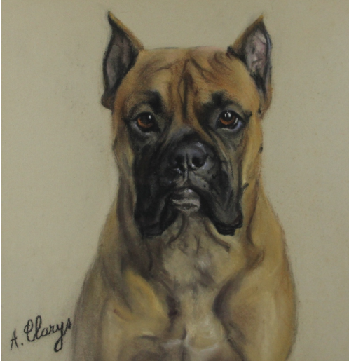
Tableau - "Le boxer"