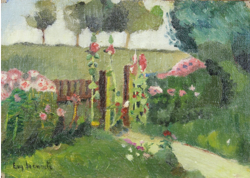
Tableau - "Le jardin fleuris"