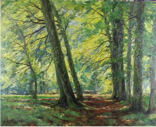
Tableau - "La forêt"