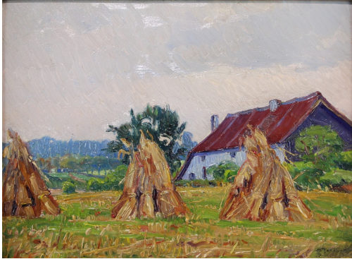
Tableau - "Les diseaux aux environs de Bruxelles"