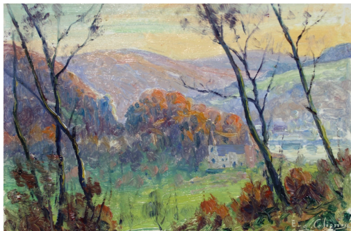
Tableau - "Vallée de la Meuse à Profondeville"