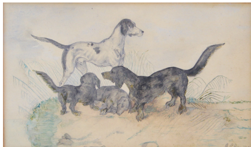
Tableau - "Les vagabonds"