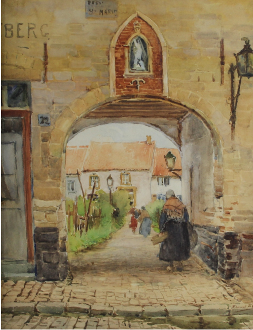
Tableau - "L'entr e de la cour"