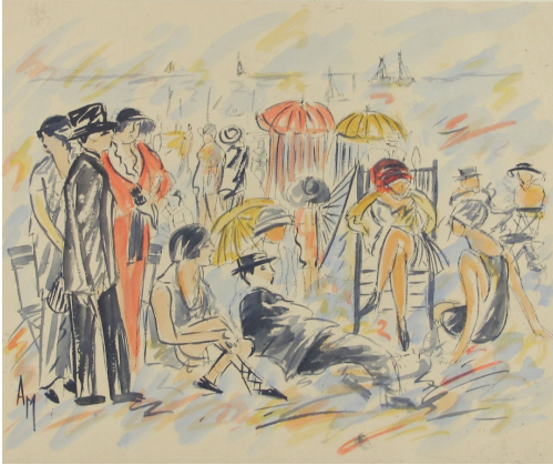
Tableau - "Conversations À la plage"