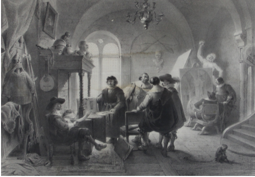
Tableau - "Rembrandt. Le bourgmestre Six visite son atelier"