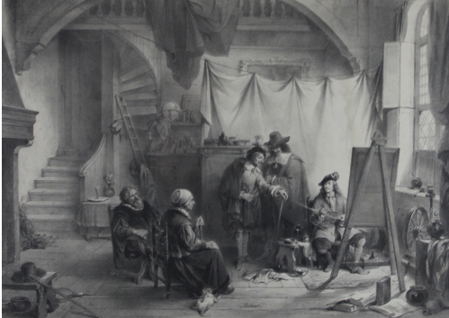
Tableau - "Gérard Dow. Son père et sa mère pose."