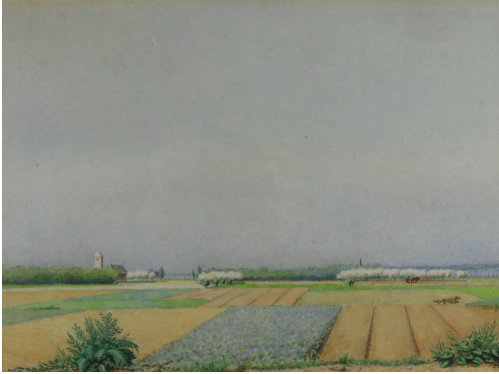
Tableau - "La charrette au champs"